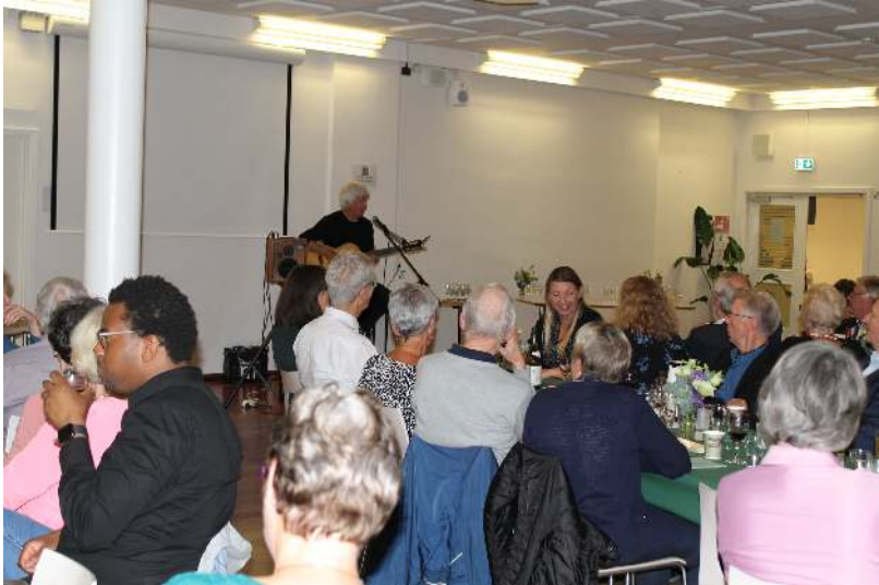
Her ses billeder fra middagen til Frivillig Fredag.